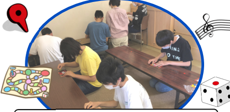
ボードゲームに挑戦しました