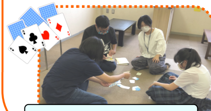
距離を保ってトランプ