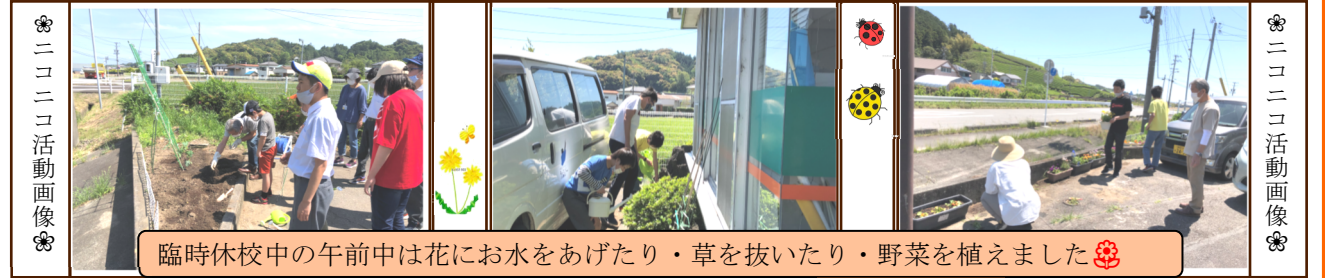
ニコニコ活動画像

学校も新型コロナウイルス感染対策の休校、分散登校を経て、やっと通常の登校が始まりました。長く不安定な日常に、子供さんはもちろん、保護者の皆様もお疲れのことかと思ひます。おれんじ坂口に、ご協力できる事がございましたらいつでもご連絡下さい。しかし、通常の日課に戻ったとは言ってもまだまだ油断はできません。引き続き、送迎車に乗る前のアルコール消毒・来所時の手洗い・うがい・アルコール消毒・トイレ使用後のアルコール消毒・3密回避の声かけ等を継続していきます。ご不明な点などございましたらお問い合わせ下さい。日中、気温の高い日もあり、今年はマスク着用の夏になると思ひます。熱中症への対応も併せて行ってまいります。