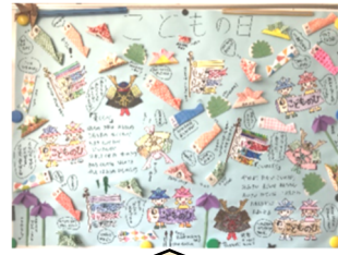
こどもの日の壁画