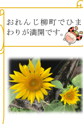
おれんじ柳町でひまわりが満開です。

長い梅雨も明け、本格的な夏の訪れを感じる季節となります。新型コロナウイルス感染拡大に伴い、移動支援においても公共の乗物について自粛をしています。引き続き感染予防には十分注意してまいります。移動支援の新規の利用者さんがいます。電動車イス利用で、公園等で歩行訓練をします。一緒に歩いてみますと、歩道の段差、道路の傾斜など、支援に入ること町の中で車いすが通るのに大変なところが良くわかります。