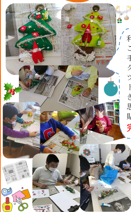
利用者様のご家族から手作りのクリスマスツリーキットをいただきました。思い思いに貼り付けて完成!!