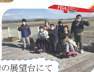
空港の展望台にて

昨年は利用者の皆様から身辺自立や課題への取り組みをはじめ、気持ちの切り替えや職員やお友だちとの関り、遊び方など、多面にわたって成長を見せていただきました。制限されてしまった活動だからこそ、細かく見えた一年だったのかもしれない。これからも社会生活を送っていく中でいろいろなことがあるのかもしれない。今年もたくましく成長されていく皆様の支援を丁寧に、安全に行ってまいります。