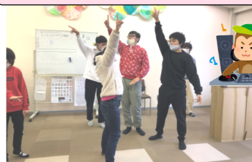
ミニわっしょいではダンス・ビンゴをしたり輪投げ・射的・釣りゲームをしました