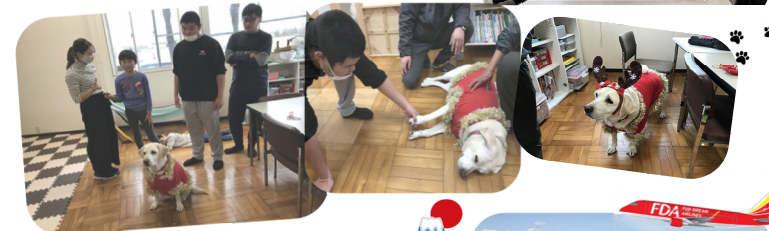
12月もバンビちゃんが来てくれました♪今回はトナカイになってくれました。