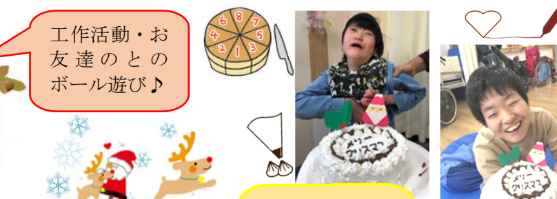
クリームをしぼって、チョコペンでデコレーション♪