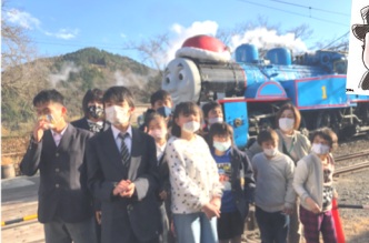
クリスマス仕様のトーマス見学