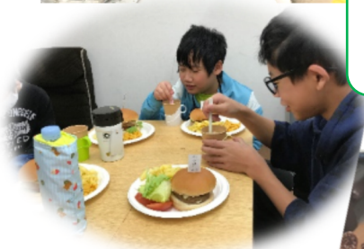
冬休みもクッキングをたくさんしました