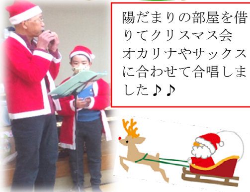
陽だまりの部屋を借りてクリスマス会オカリナやサックスに合わせて合唱しました♪