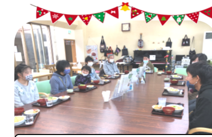
ひだまりカフェでの昼食(^^)