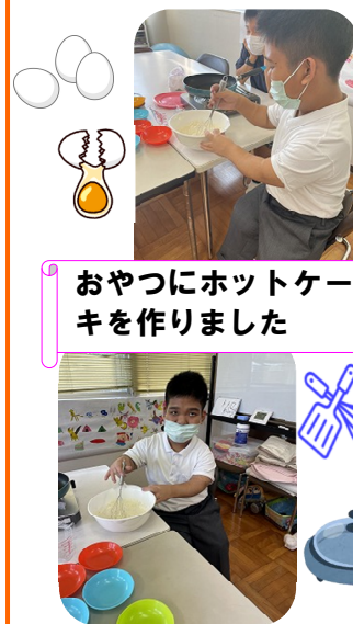
おやつにホットケーキを作りました