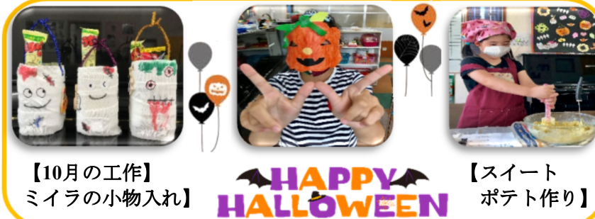
【10月の工作】 ミイラの小物入れ HAPPY HALLOWEEN 【スイートポテト作り】

【めえめえカフェ】 急な出産で、カフェがOPENできず、ごめんなさい。 でも無事に、4匹のかわいい子ヤギが生まれましたよ。(^^^)/ 🐶 🍀 🐶 🍀 🐶 🍀 🐶 ヤギミルクのソフトクリーム、是非また食べに来てね♡！