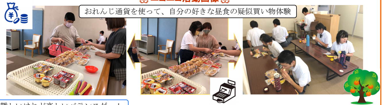
おれんじ通貨を使って、自分の好きな昼食の疑似買い物体験