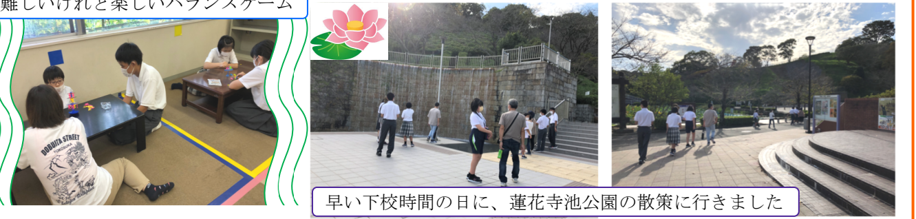
早い下校時間の日に、蓮花寺池公園の散策に行きました