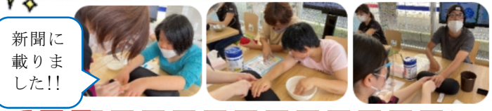
新聞に載りました!!

オールしずおかさんとウェルシア薬局さんの「ネイルサロン会」に参加しました。みんなで貴重な楽しい時間を過ごしました。