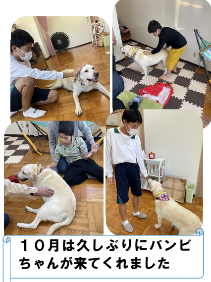
10月は久しぶりにパンピちゃん came くれました

時折感じる暖かい日差しにホッとしますが、冬の気配も感じられる頃となりました。天候や気温の変化で体調を崩さないよう、引き続き体調管理に注意してまいります。 先日保護者様より、「お弁当と一緒に作りたいと初めて言ってきました。早起きして頑張るようです。頼もしくなってきました。」との報告がありました。すっかりお兄さんらしくなっていて、おれんじ初倉でも自分なりの過ごし方を見つけ、楽しんでいるように見受けられます。これからも体調面も含め、ご家庭での様子、ぜひたくさん教えてください。