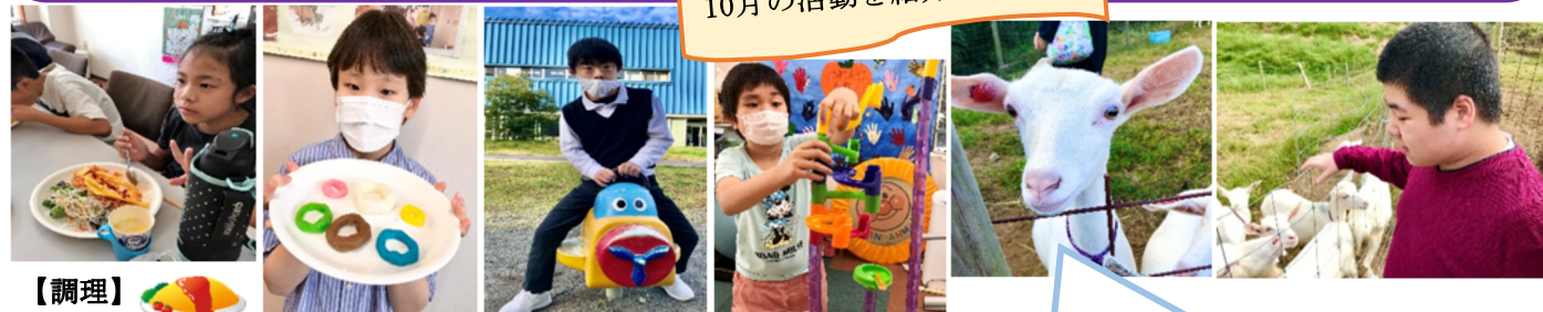
【調理】 オムライス 【しんこ細工】 【ローズアリーナ】 【フリールーム】