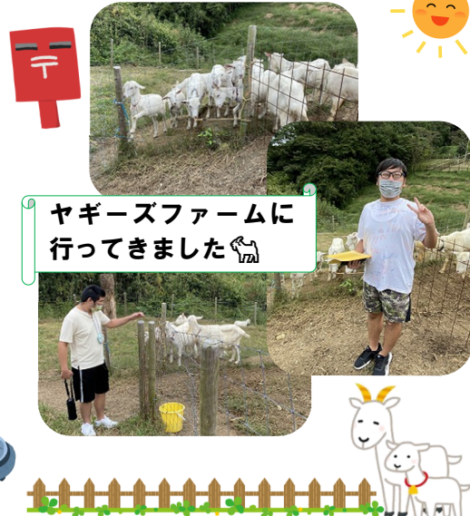
ヤギズファームに行ってきました🐐