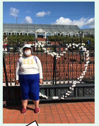
島田市ばらの丘公園ローズガーデン