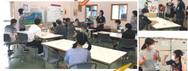
1・2の会ボランティアさん読み聞かせ

オールしずおかさんとウェルシア薬局さんの「ネイルサロン会」に参加しました。みんなで貴重な楽しい時間を過ごしました。