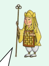
貴重なコレクションの一端です