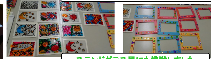
スタンドグラス風にも挑戦しました