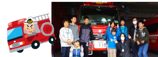
土曜開所の活動で焼津市消防防災センターへ