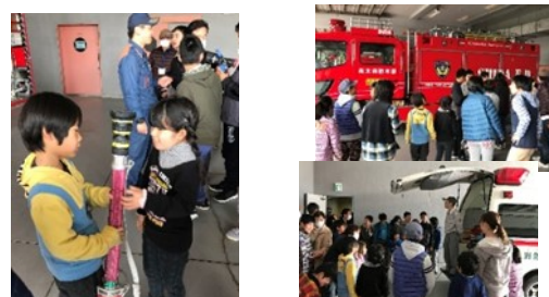
焼津市消防防災センター 土曜開所日