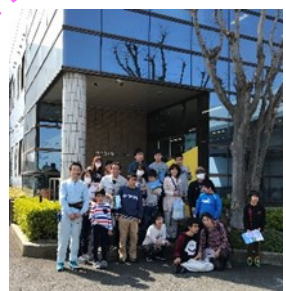
フクロイ乳業 見学

島田市内の学校給食用の牛乳も作られていました。お土産にももらった牛乳をみて、「いつも飲んでるー」という子どもに「ありがとう」と職員さんが答えてくれました。