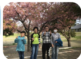
吉田町立図書館にきれいな桜が咲いていました☆