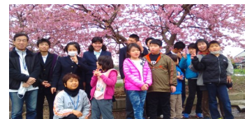
満開の河津桜の下でパチリ