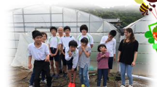
ハウスの前でパチリ★