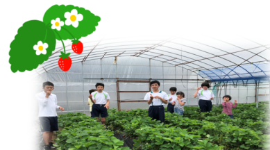
小雨だったけど楽しかった♪