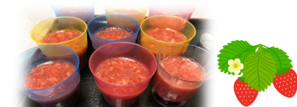
甘くて美味しかった★