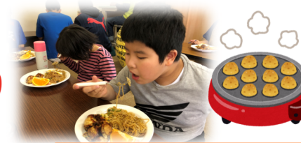
焼きそばとたこ焼きの昼食とおやつのケーキ*