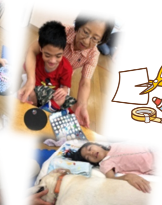
セラピー犬のバンビちゃんともすっかり仲良くなりました♪