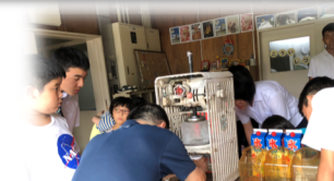
松林堂さんのかき氷体験