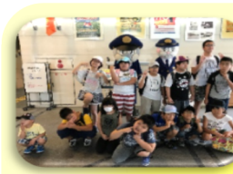
静岡県警察本部見学