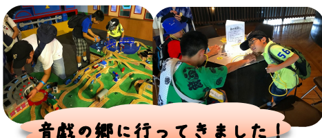
音戯の郷に行ってきました！