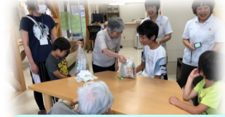
藤枝のグループホームに遊びに行きました