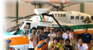
静岡のヘリポート見学