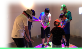
電車に乗って「るくる」へ行きました♪