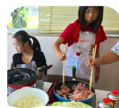
クッキング♪ この日はお好み焼きでした！