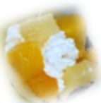
カップケーキ作り♪デコレーションもしてみ～んな完食おいしかったね♪

今年の夏は、とても暑かったですが、みんな元気に過ごすことができました。夏休みはお出掛けしたり、おやつを作ったり、お友達と一緒に様々な活動をしました。まだまだ暑い日が続きますが、秋の行事に備えて体調を整えながら過ごしましょう！