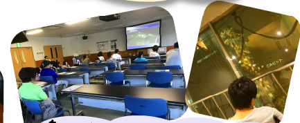
島田市環境プラザでゴミ処理方法等の説明や施設見学をさせていただきました。