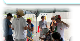
交流会の流しそうめん