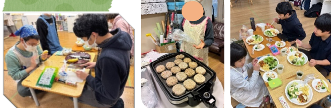
煮込みハンバーグとツリーのようなカナッペを作りました。