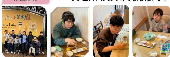
ジブリ展の後に、今回は「もぐもぐキッチン」さんで昼食外食体験をさせていただきました。