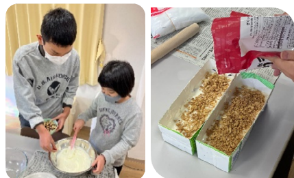
カッサータは夏休みに作り好評でリクエストがあり作りました(^o^)