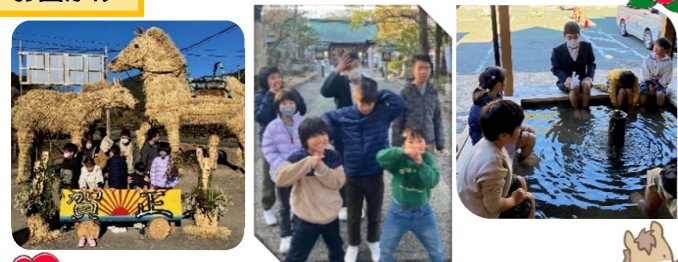
今年のジャンボ干支も迫力がありました！