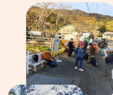
満願峰(焼津・静岡) 低山登山時の様子

今、移動支援事業の継続が困難になっています。利用希望は多いのですが、ヘルパーが少なく、70代のヘルパーが頑張ってくれています。移動支援の給付費も安く、身体介護なしで1時間の場合に事業所に入るのは約2000円です。夏は酷暑の中、冬は寒風の中、利用者さんの体調を気遣いながら支援に努めてくれています。今後もこの事業が継続していけるよう、ヘルパー登録して、平日・休日の空いている時間に支援に入ってもらえる方がいたら嬉しいです。