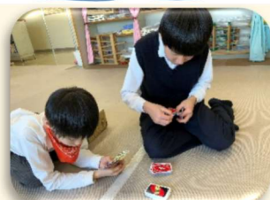
UNO やトランプにハマっています

2月になり、まだまだ寒い日が続いていますが、子どもたちは元気に過ごしています。最近では節分に向けた制作や、体を動かす遊びを通して、友だちとやりとりする姿が多く見られています。一人ひとりのペースに合わせてながら、「できた！」「伝わった！」という経験が積み重なるよう、今月も支援してまいります。