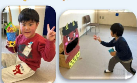
豆まき & お菓子まき