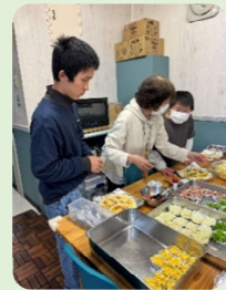
遊具でたくさん遊び、ピザ作りをして昼食に食べました。