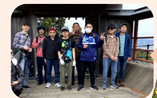
諏訪原城跡 (島田市)

今年も猛暑になるかと思えます。昨年のうるび～研修の中で、講師の先生が「体を少しずつ暑さに慣らしてください」と言われていたことを思い出しました。