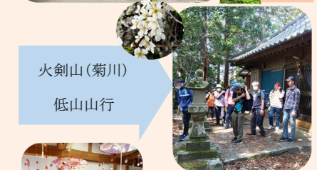
火剣山(菊川) 低山山行