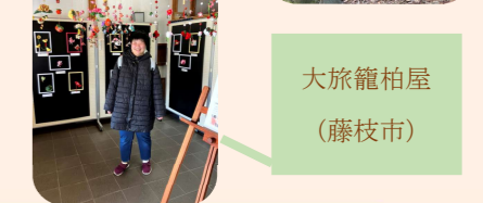
大旅籠柏屋 (藤枝市)