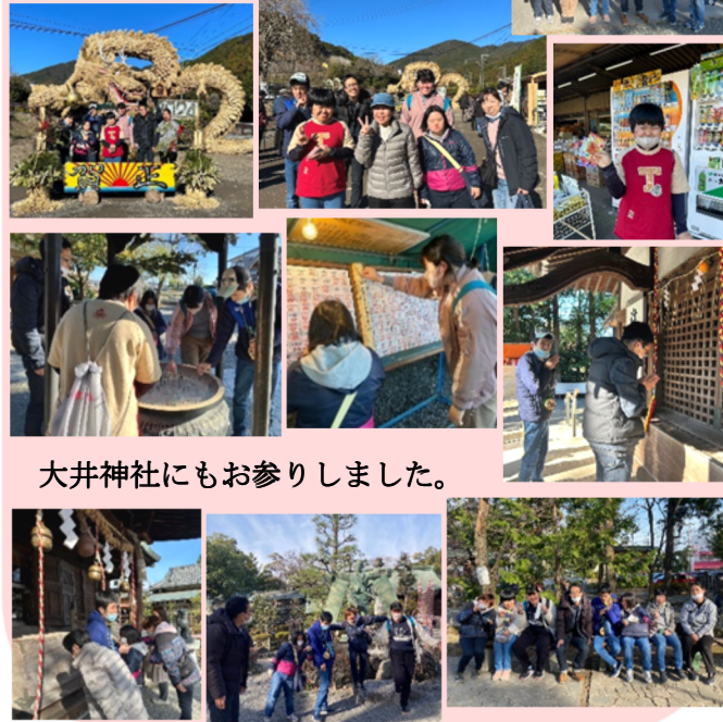
大井神社にもお参りしました。