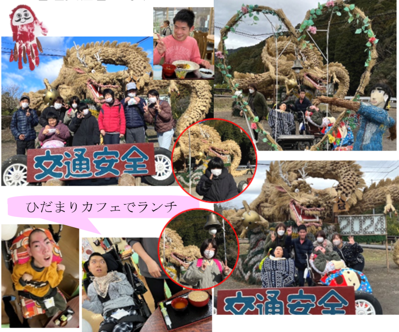
ひだまりカフェでランチ