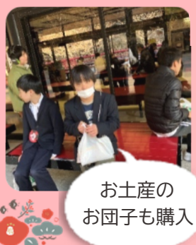
お土産の お団子も購入