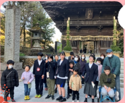
新年 法多山に初詣へ

立春がすぎ、2月になると少しずつ日が伸びてきて日中は暖かさを感じる日もありますね。しかし朝晩の冷え込みや乾燥はもう少し続きそうで、風邪やインフルエンザ等の感染症がまだまだ流行っているニュースを耳にします。たくさん食べてたくさん寝て、規則正しい生活で免疫力を高め、元気に冬を乗り越えていきましょう。