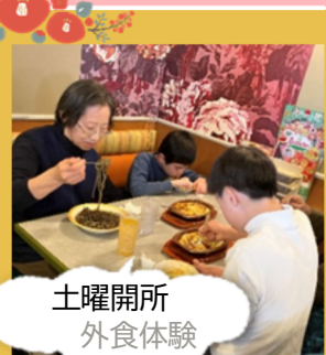
土曜開所 外食体験