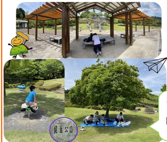
土曜開所の日に貝立公園に行ってきました！