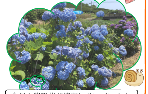
今年も紫陽花が綺麗に咲いています