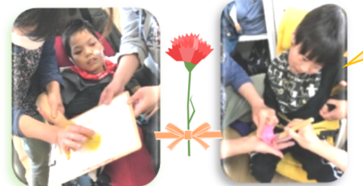
母の日のプレゼントお母さん喜ぶかな〜♪