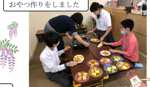
おやつ作りをしました