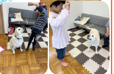
4月もバンビちゃんが遊びに来てくれました♪

梅雨明けもですが、新型コロナウイルスのワクチン接種も待ち遠しく感じています。早く思い切り外出できるようになると良いですね。