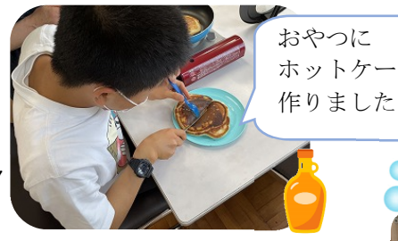
おやつにホットケーキを作りました😊