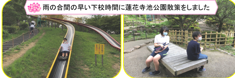
雨の合間の早い下校時間に蓮花寺池公園散策をしました